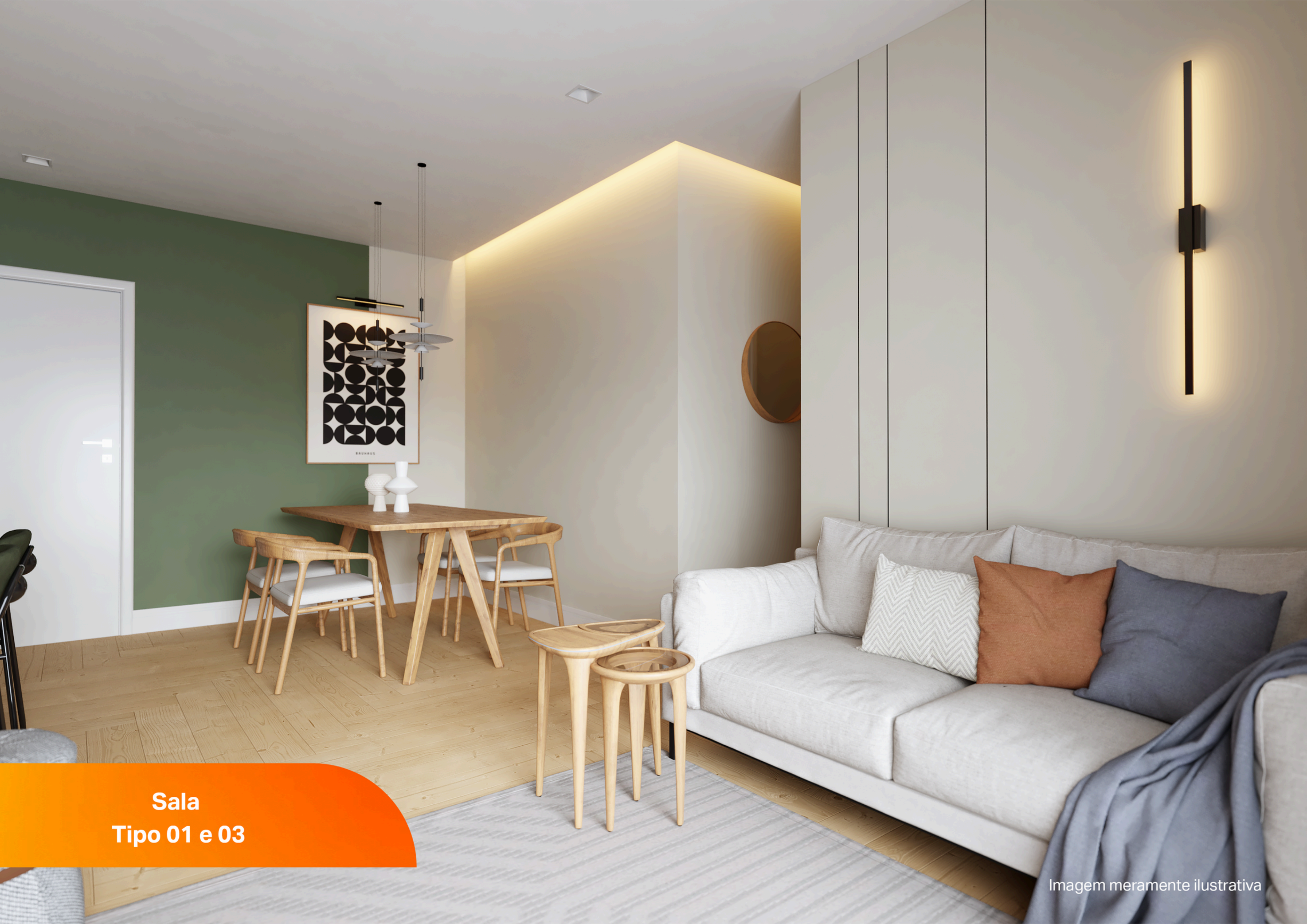
Sala Tipo 01 e 03